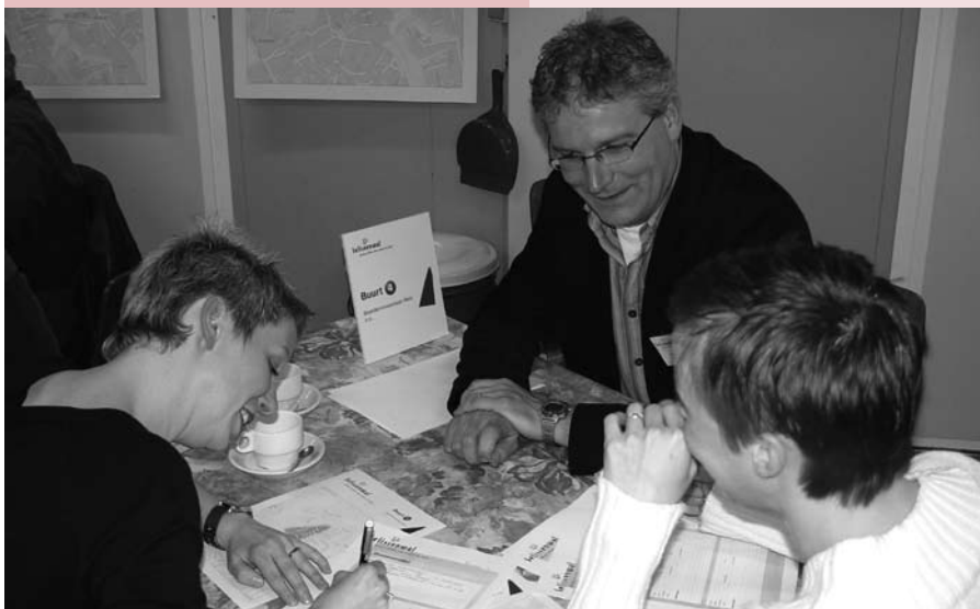
Bewoners konden op de meedenkavond hun wensen en ideeën kenbaar maken