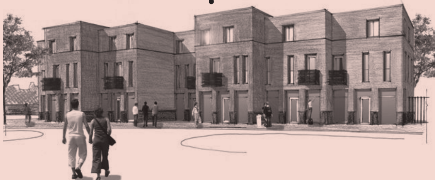
Het nieuwe plan, zoals dat 12 maart zal worden gepresenteerd