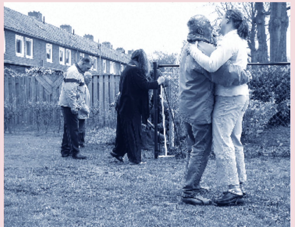
Er werd niet alleen gewerkt op de opknappdag, er was ook tijd voor een dansje!

Een tuin is pas een eigen tuin als er ook een hek omheen staat. Daarom is er op kosten van de gemeente, Cello en Woonstichting St. Joseph een splinternieuwe omheining geplaatst. Dat is handig, want nu kunnen