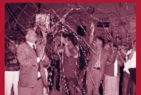
Dankzij de inspanningen van het speciaal opgerichte comité kreeg de opening professionele allure.

Met de verhuizing naar het nieuwe gebouw breekt voor jeu de boulesvereniging De Walnoot een nieuwe periode aan. "We hebben nu weer de rust en de tijd om ons met andere zaken bezig te houden", zegt Brigjt. "Die tijd willen we benutten met